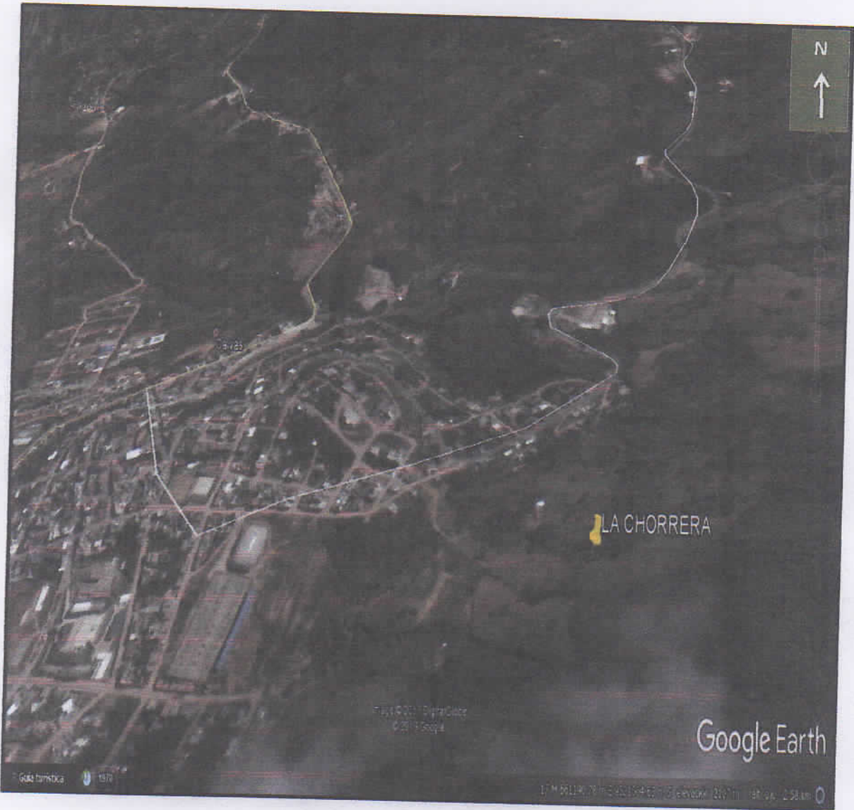
DIAGRAMA DEL MUESTREO